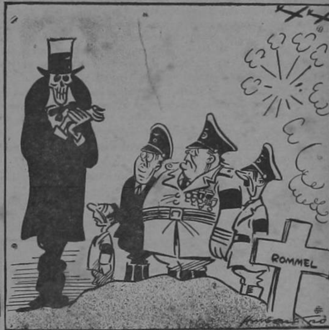
"Y no es más que el principio, muchachos..."