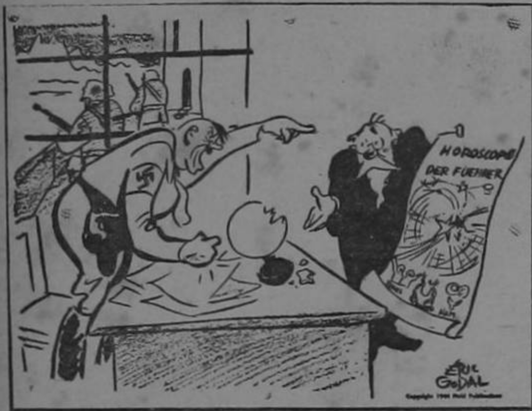
"Pues entonces cambie Ud. el curso de las estrellas!"

"Querido señor: Permitame informarle que anoche se nos sirvió una tortilla en la cual se encontraban dos moscas. Pero yo había pedido una tortilla para cuatro personas. ¿No cree usted que en lo sucesivo sería más conveniente poner una mosca por persona o no poner ninguna? Reciba usted etc."