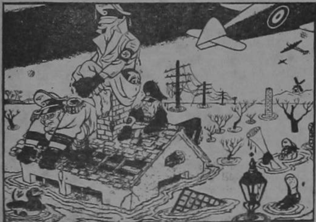
"Oye, Adolfo, a ver si encuentras alguna paloma por ahí...!"