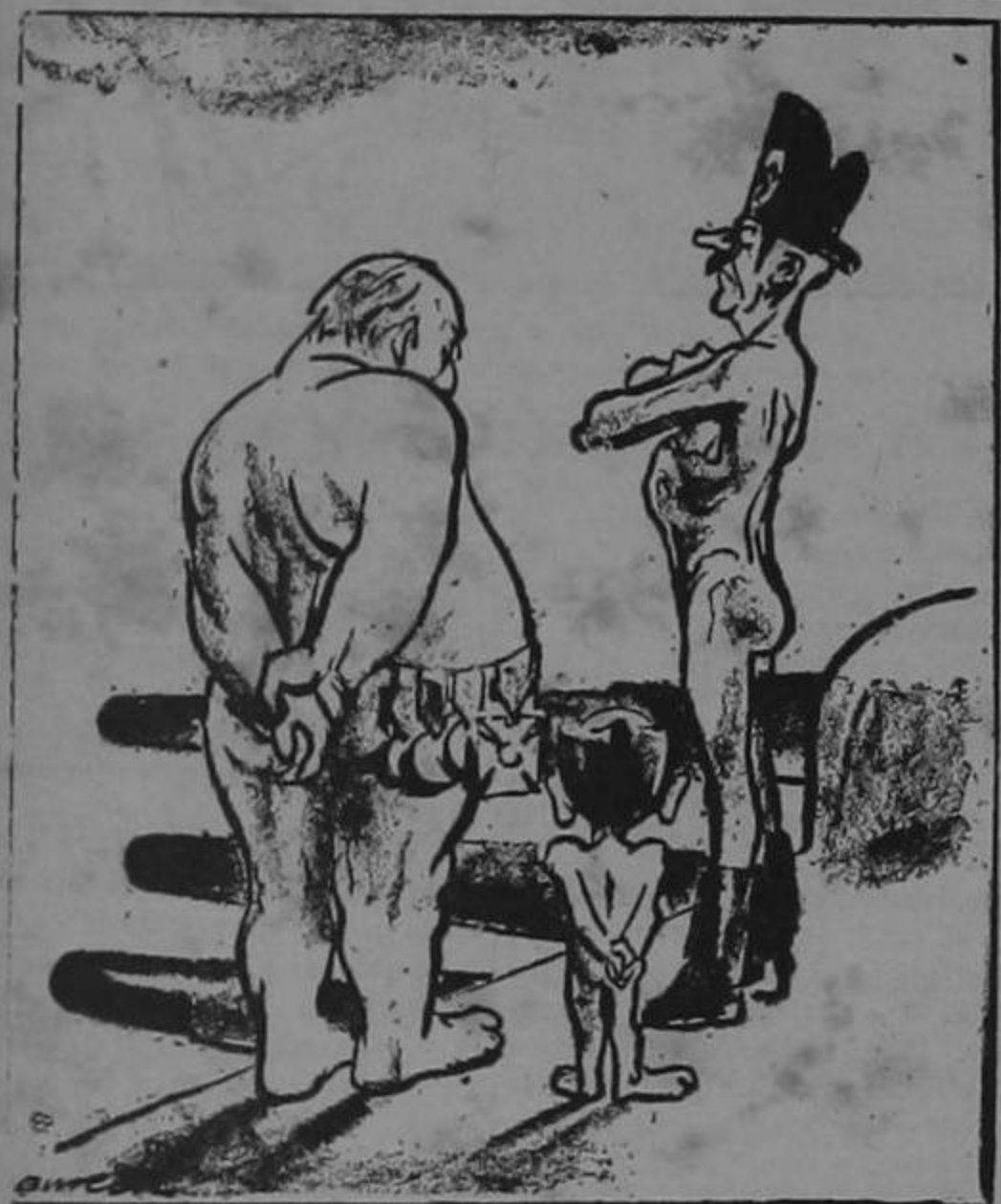
"Verdaderamente, mein fuehrer, que no estamos muy bien equipados para hacer frente a otro invierno..."