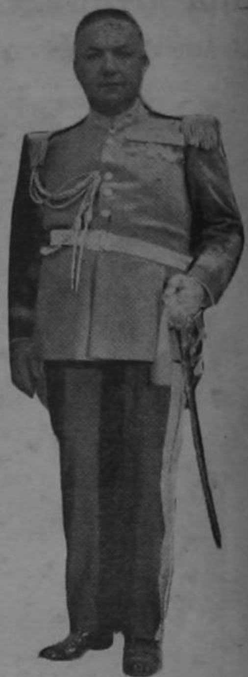
legado a la altura del corazón de todos sus amigos.